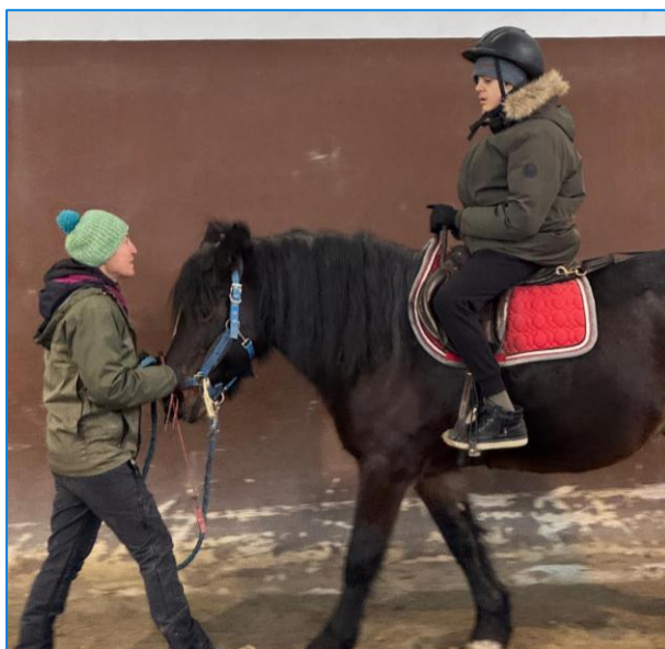
Attività Ludico Ricreativa a cavallo