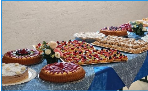
Buffet preparato dalla nostra cucina

I pasti quotidiani sono preparati e forniti dalla cucina interna alla struttura che utilizza prodotti freschi di stagione e, quando possibile, a km 0.