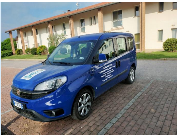
Doblò della Fondazione

È garantito l’accompagnamento degli ospiti con mezzi attrezzati per eventuali visite mediche specialistiche e accertamenti diagnostici presso le strutture del Servizio Sanitario Locale.