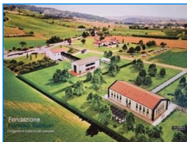
Progetto "Polo Formativo"

Tra i progetti ambiziosi ed innovativi della Fondazione Fornino Valmori vi è quello di costruire un Polo Formativo per aspiranti operatori (Educatori, OSS, ecc.) per promuovere opportunità di lavoro e formazione professionale sempre più aggiornata nell'ambito dell'autismo, riconosciuto a livello Istituzionale e in collaborazione con l'Università di Bologna.