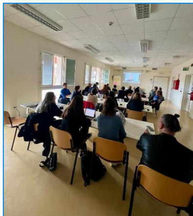
Formazione in aula

Il PEI è sottoscritto dai famigliari, tutori o amministratori di sostegno, dai committenti, dalla Coordinatrice di struttura e dagli operatori referenti. È aggiornato e verificato semestralmente.