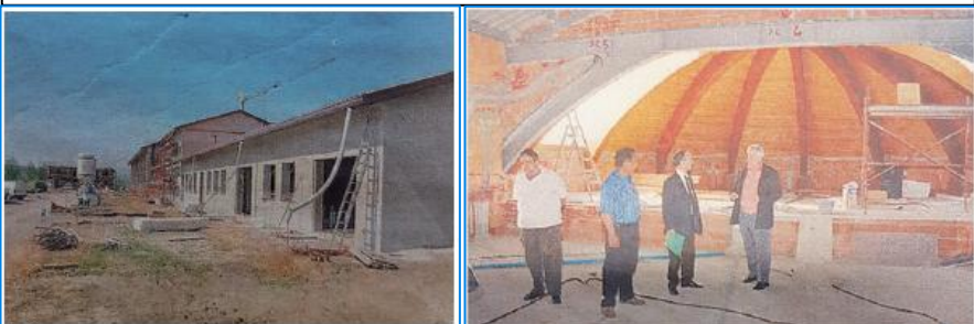
Costruzione e Ristrutturazione degli spazi della Fondazione Fornino Valmori

La volontà dei fondatori è stata quella di dare voce a quei disagi sui quali ancora troppo spesso predomina un vuoto assistenziale da parte delle istituzioni.