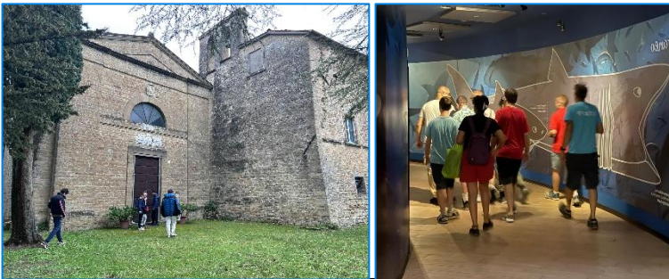
Uscite e momenti di socializzazione

Sono adottate e previste misure di controllo per evitare qualsiasi forma di abuso.