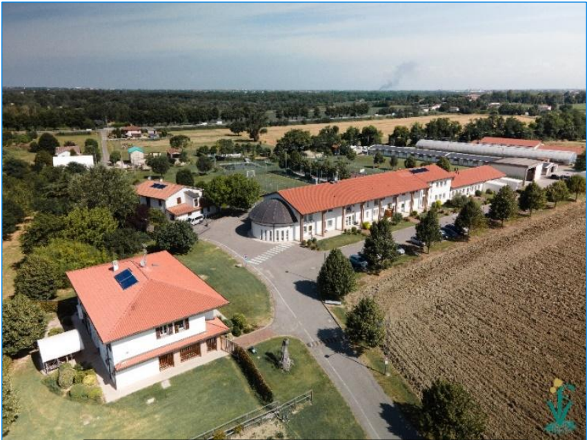
Vista dall'alto degli spazi della Fondazione Fornino Valmori

La filosofia che sta alla base del lavoro quotidiano è quella di offrire qualità, efficienza e professionalità dei servizi, attraverso la promozione di valori necessari e indispensabili, quali solidarietà e partecipazione, al fine di garantire una reale qualità della vita agli ospiti inseriti.