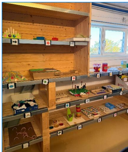
Progetto "Scatole di lavoro"