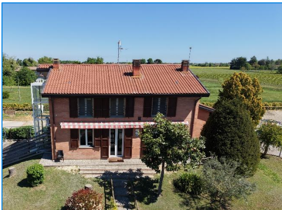
Nucleo "Casa Mattoni"

Tale struttura, inaugurata nel 2021 e ampliata l'anno successivo, è collocata di fianco alla serra e alle scuderie dei cavalli.