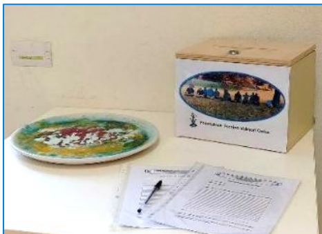
Cassetta degli elogi, reclami e suggerimenti

Promuove iniziative di coinvolgimento attraverso la formulazione di suggerimenti, reclami ed elogi finalizzati al miglioramento e alla qualità dei servizi offerti. Qualora i familiari, o chi nutra interesse, rilevino disservizi, possono inoltrare reclami o proporre suggerimenti che potranno pervenire alla Cooperativa in forma cartacea, via e-mail o attraverso la compilazione del relativo modulo disponibile sul sito internet della Cooperativa. Il Responsabile Qualità (Coordinatrice) risponderà in forma scritta (entro e non oltre i 30 giorni dal ricevimento del reclamo o suggerimento) e si attiverà per rimuovere le cause che hanno provocato il reclamo.