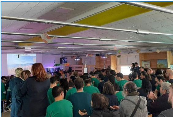
Festa con le famiglie

È sempre possibile esprimere valutazioni sulla qualità delle prestazioni erogate e inoltrare reclami e suggerimenti.